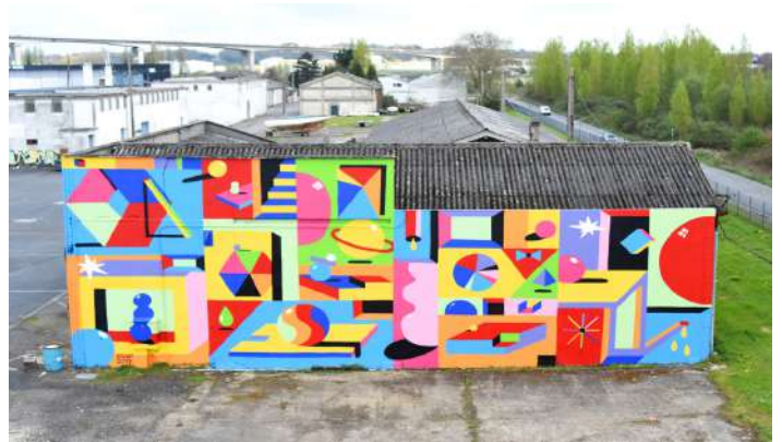
2SHY, graffeur, festival PALMA à Caen