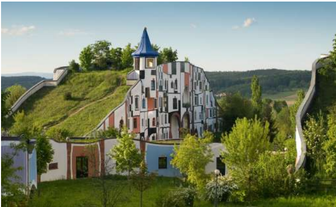
Hundertwasser - Village thermal de Blumau